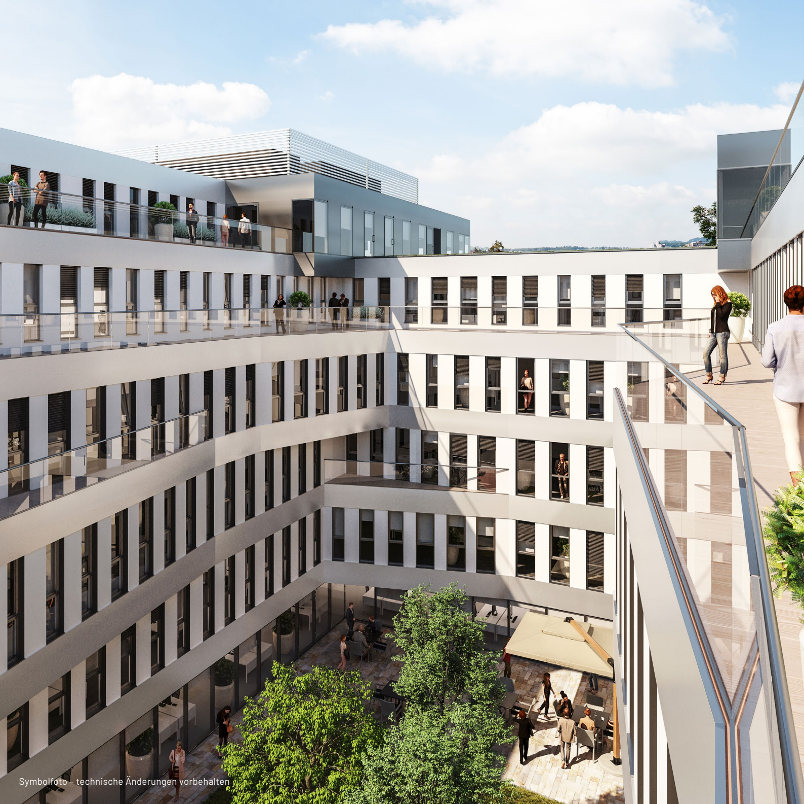
Symbolfoto – technische Änderungen vorbehalten